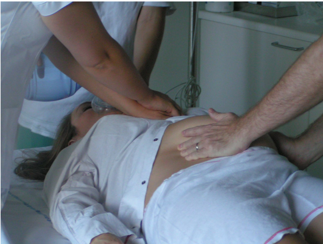
Figur 2. Genoplivning ved graviditet.

Faktaboks ved hjertestop hos gravide med en gestationsalder over 20 uger.